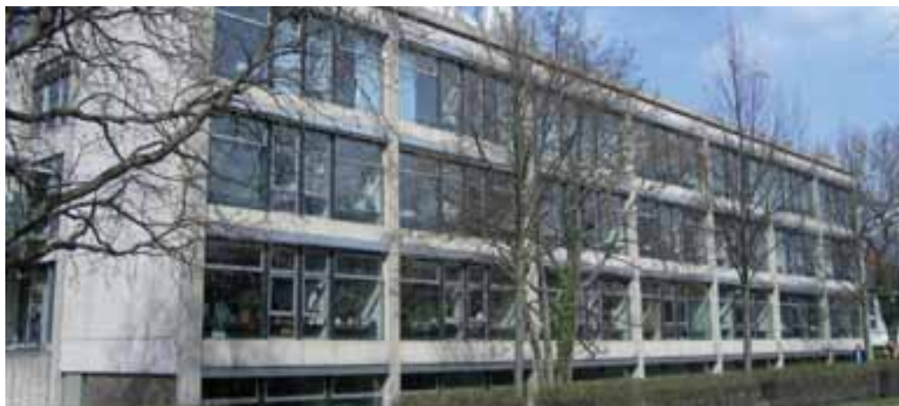
Die dem Institut für Agrartechnik angegliederte Landesanstalt für Agrartechnik und Bioenergie.

Als Produkte der Hydrolyse und Acidogenese entstehen überwiegend kurzkettige Fettsäuren, wie Propionsäure, Buttersäure und Milchsäure sowie Alkohole. In der Aceto- und Methanogenese erfolgt dann die Umsetzung dieser Säuren zunächst zur Essigsäure und dann zu Biogas. Die Bestimmung der absoluten Konzentration dieser leicht flüchtigen organischen Säuren (FOS) sowie die Bestimmung des Verhältnisses von Essigsäure zu Propionsäure sind wesentliche Kontrollinstrumente zur Überwachung des Gärprozesses. Unter Berücksichtigung der unterschiedlichen Molgewichte wird die Gesamtkonzentration der organischen Säuren im Gärsubstrat auch zum sog. Essigsäureäquivalent aufsummiert [1] .