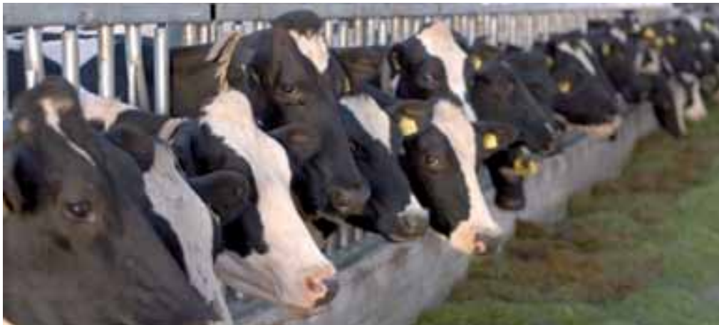
Flüssig- und Festmist von Grossvieh stellt das Grundsubstrat zur Biogaserzeugung dar.