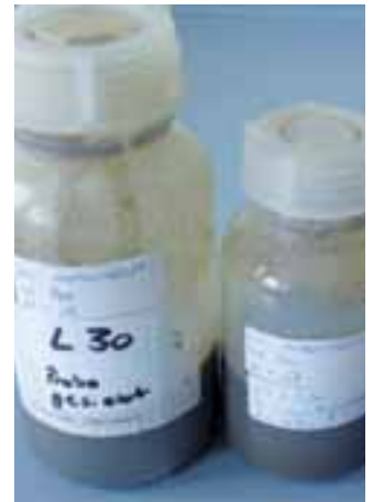
Verschiedene Fermenterproben stehen zur Analyse bereit.